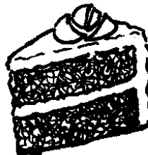
pas - tel