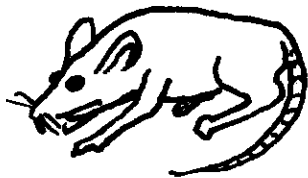
r - ata